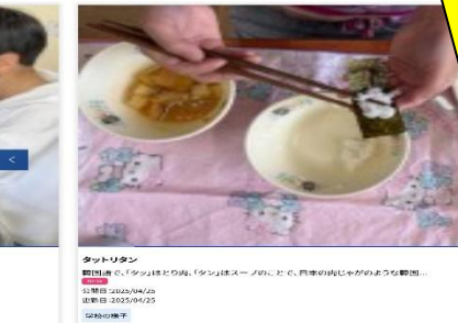
ネットリタン 職員室で「タン」を味わい、「タン」はスーパードリッパの肉じゃがのような瞬間。 公開日: 2022/04/25 更新日: 2022/04/25 投稿者: 藤田

メインとなるブログ掲載記事です。その日の子ども達の学習や活動の様子、学校の取組み等を、写真と文章でできるだけわかりやすくお伝えします。写真は、他への使用やSNS等への転載はおやめください。