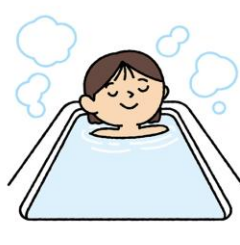
お風呂でしっかり湯船につかり