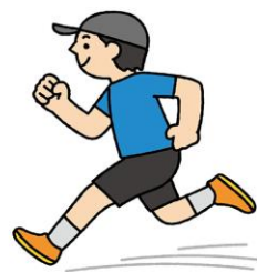
毎日、少しずつでも運動しよう