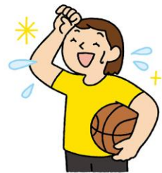
基本はしっかり汗をかくこと

毎日少しずつ1～2週間続けると体が暑さに慣れて、熱中症になりにくくなります（暑熱順化）