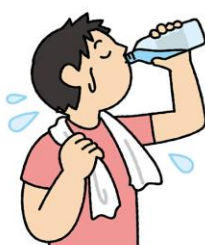
汗をかいたらこまめに水分補給