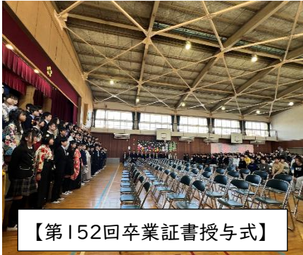
【第152回卒業証書授与式】

地域、保護者の皆様におかれましては、引き続き、本校の教育活動にご理解とご協力を賜りますようお願い申し上げます。