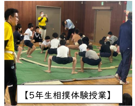
【5年生相撲体験授業】