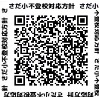
さだ小不登校対応方針 さだ小不登校対応方針 さだ小不登校対応方針 さだ小不登校対応方針