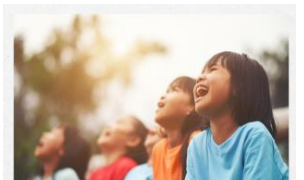
枚方市 子どもの居場所サポートガイド ～不登校支援ガイド～

枚方市は、様々な形で、子どもの居場所づくりを進めています。本市方針をもとに、さだ小学校においても「学校不登校対応方針」を策定しました。本日、「枚方市子どもの居場所サポートガイド」とともにGoogleクラスルームの「お手紙クラスルーム」内に配付しております。また、学校ブログにも掲載しておりますのでご覧ください。