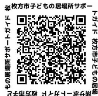
枚方市子どもの居場所サポートガイド 枚方市子どもの居場所サポートガイド