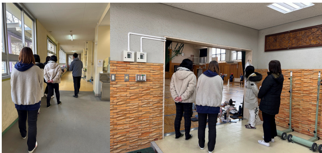
[学校内の視察風景]

トイレや廊下、共有スペースなど学校内の環境に関しても定期的に視察することによって環境の変化を体感することができます。体育館に冷暖房が付いた時などもいち早く見学することができました。こうした視察を通して、学校全体の取り組みや、子どもたちの成長する日常を身近に感じられることを嬉しく思います。