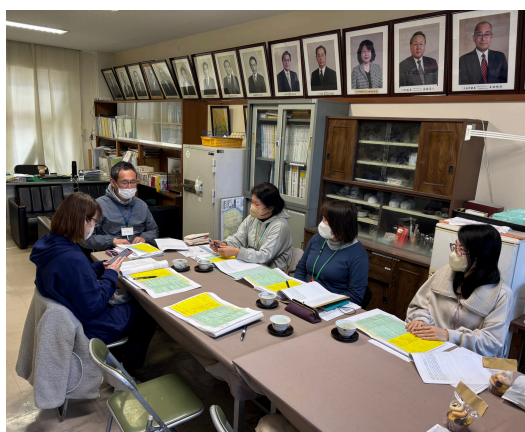
[校長室での定例会議風景]

校長先生より学校の教育目標に応じた新たな取り組みを説明して頂き、それについて意見を出し合います。今年度でいえば研究授業のテーマであった、自由進度学習や一部のクラスの問題点について、また五常小学校の教育指針などを色んな立場の人たちで話し合いました。