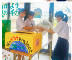
生徒が協力して、着なくなった服を世界の子どもたちに届けるプロジェクトです