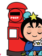
枚方市ひこぼしくん