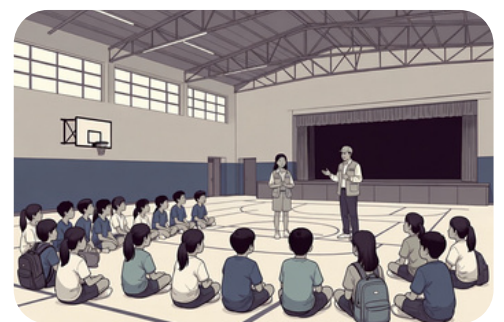
学校防災キャンプの支援

上記のほかにも、地域の皆さまには各学校や地域の状況に応じて、子どもたちや学校を支えてくださっていることに、深く御礼申し上げます。裏面は、文部科学省が作成した広報チラシ（給特法等一部改正法に関する資料）です。「3ご協力いただきたいこと」に記載されている内容について、本市においては、すでに皆さまにご協力いただいているところです。これからも子どもたちへのよりよい教育のため、引き続き、温かいご支援・ご協力を賜りますよう、よろしくお願い申し上げます。