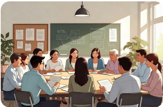
コミュニティ・スクールでの協働