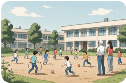
中休みの見守り活動