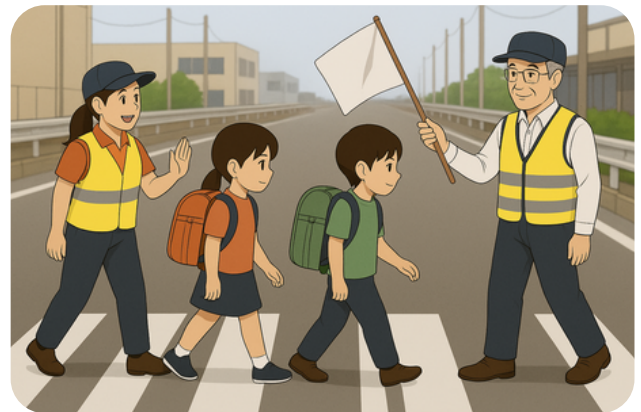
登下校時の見守り活動