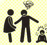
不適切な家庭環境