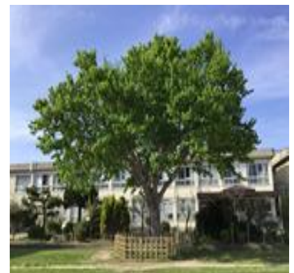
(山田小の象徴 「ゆりの木」)

授業改善のため、ご協力をお願いいたします。アンケート用紙は封入し、個人懇談会にお持ちいただくか、お子様を通して、担任にご提出ください。