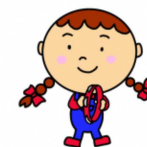
大阪府警察本部交通部交通安全キャラクター なっちゃん