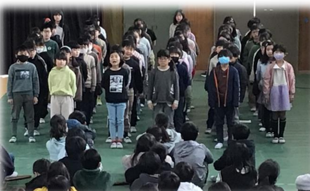
きれいな歌声を送る3年生★