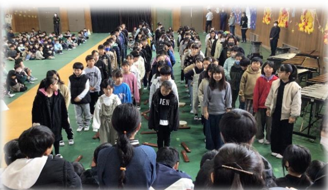
進行役をし、元気いっぱいの歌を届けた4年生★