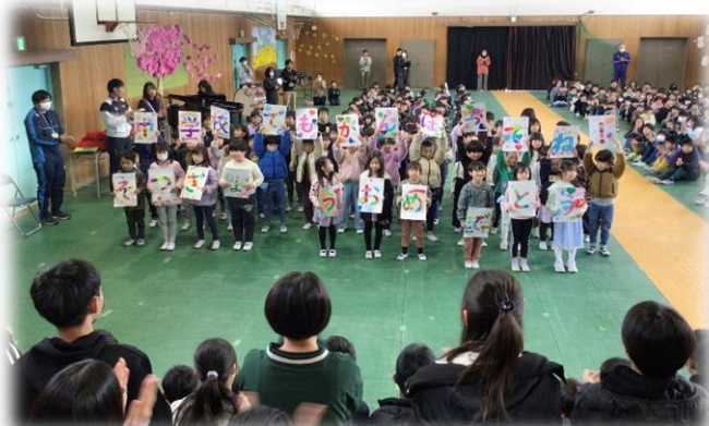
カラフルなメッセージを送る1年生★

5年生が作った虹のアーチをくぐって入場する6年生。てれくさそうに入場する6年生に低学年の子が手を振っていました(#^^#)