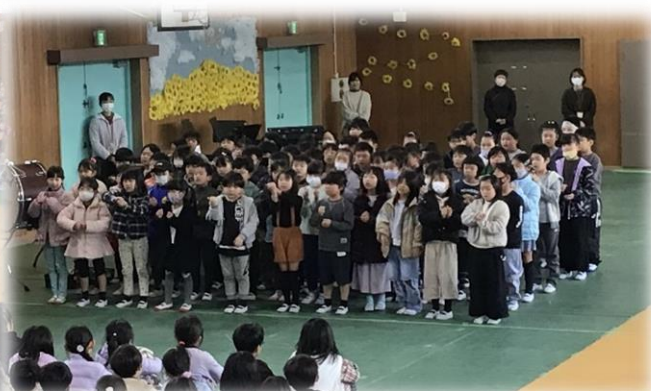
世界に1つだけの花～❁手話で送る2年生★