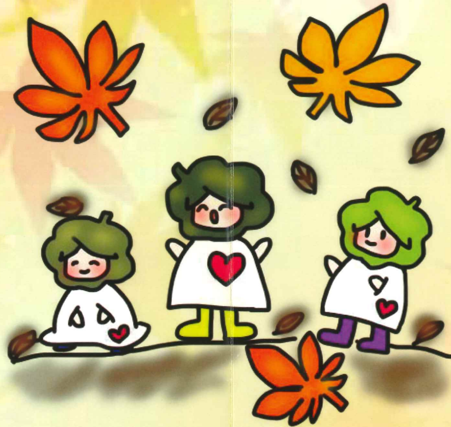
クローバーの妖精 すこっちゃん