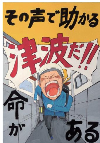
高校生・一般の部 香川県 英明高等学校 林 和花さん

お問い合わせ 〒171-0033 東京都豊島区高田3丁目6-7 ニュー野村マンション101号室 「第42回 防災ポスターコンクール事務局」 (株式会社シバムジーク内) 電話 03-6912-6151 受付時間 平日/午前 9:00～12:00 (土・日・祝日を除く) 午後 13:00～17:00