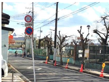
学校前の道路は駐車禁止・徐行を

学校の正門前の道路は駐車禁止です。特に子どもたちの登下校時に駐車している車があると、団地に向かっ手道路がカーブしていることもあって、見通しが悪くなり、安全に通行できなくなる恐れがあります。子どもたちの送り迎えの際など、学校周辺の道路に駐車することはやめていただきますようにお願いします。