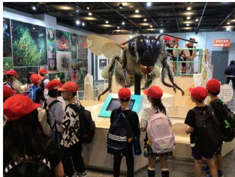
3年生 伊丹市昆虫館