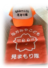
暑い日も、寒い日も、雨の日も、子どもたちの安全を見守って下さっています。本当にありがとうございます。