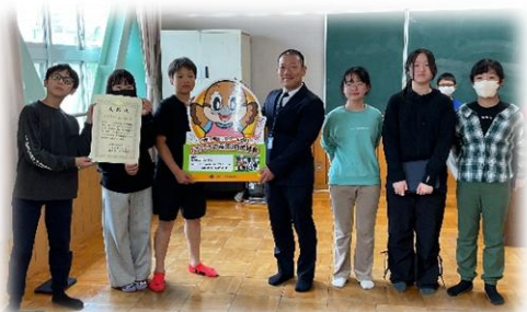
中宮小学校の代表として、代表委員が表彰を受け取りました。

本校が大切にしている「時を守り、場を清め、礼を尽くす」という、人としての土台を育む取り組みを、これからも子どもたちとともに大切に積み重ねていきたいと思ひます。