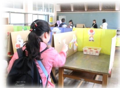
【カップインゲーム】→ 当たりの赤カップをねらってね