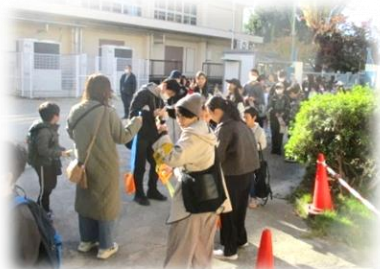
【受付】 いよいよ始まります

11月23日(日)にPTA主催の「わくわく祭り」が開催されました。 毎年の恒例行事として、子どもたちはとても楽しみにしており、たくさんの笑顔が見られました。 PTA行事委員さんをはじめ、役員の皆様、お手伝いくださった皆様、本当にありがとうございました。