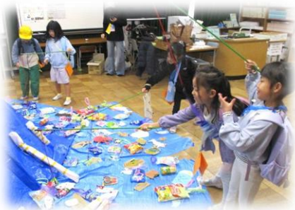
←【おかしつり】 お目当てのお菓子 GET