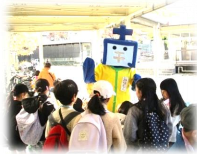
子どもたちに大人気!