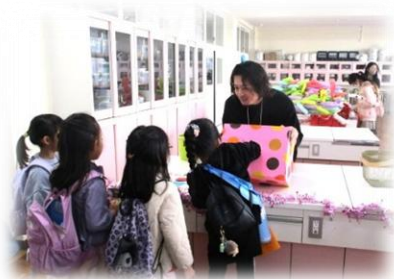
【あてもの】なにがあたるかな?