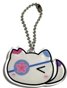
アクリルチャーム

川越小学校のマスコットキャラクター「川越ボール」のアクリルチャームが完成し、本日、児童一人ひとりに1つずつプレゼントしました。この取り組みは、5年生の児童が探究学習として進めてきた「川越小学校のマスコットキャラクターを作ろうプロジェクト」の一環です。大切に使用していただき、川越小学校への愛着をさらに深めてもらえたらと思います。