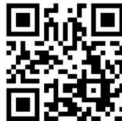
🖐 制作の様子 (約2分の動画)

川越小学校のマスコットキャラクター「川越ボール」のアクリルチャームが完成し、本日、児童一人ひとりに1つずつプレゼントしました。この取り組みは、5年生の児童が探究学習として進めてきた「川越小学校のマスコットキャラクターを作ろうプロジェクト」の一環です。大切に使用していただき、川越小学校への愛着をさらに深めてもらえたらと思います。