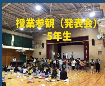
授業参観（発表会） 5年生