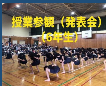
授業参観（発表会） 6年生