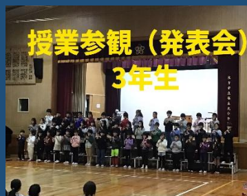
授業参観（発表会） 3年生