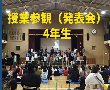
授業参観（発表会） 4年生