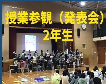
授業参観（発表会） 2年生