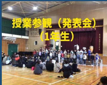
授業参観（発表会） 1年生