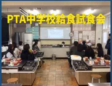
PTA中学校給食試食会