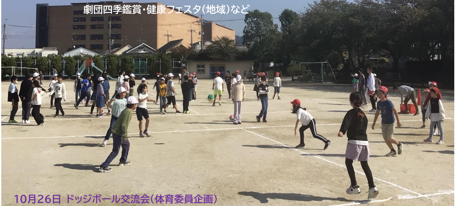
10月26日 ドッジボール交流会(体育委員企画)