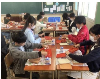
中学校給食試食会(6年)