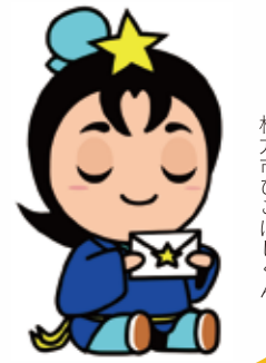
枚方市ひこぼしくん

あなたが いじめで こまっていぬとき、 どうしたらいいかを いっしょにかんがえます。 こまったとき、つらいとき、いじめをみたとき、 あなたのおはなしを きかせてください。 ひみつはまもるので、あんしんしてください。