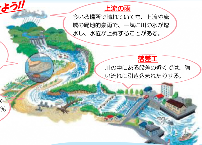
(公財) 河川財団 水辺の安全ハンドブックより

一見穏やかに見える流れも、川底の影響で流水は一定ではない。川の事故の約 90% はこの穏やかな流れで発生している。