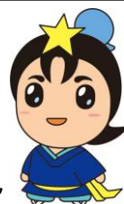
枚方市 ひこぼしくん

ひらかたし しょうちゅうがくせい 枚方市の小中学生のみなさん のために、たの じっけん や工作な どをよういしています。 みなさんのまんかを待っています。