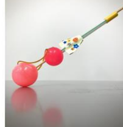
すっ飛びストロー