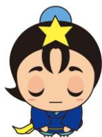
枚方市 ひこぼしくん