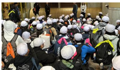
ホテルに到着しました