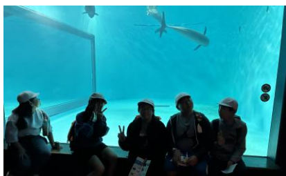
日本では珍しいスナメリがいます