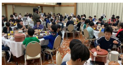
晩御飯はハンバーグでした