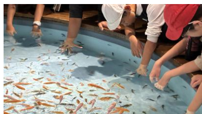
魚が角質を食べてくれます