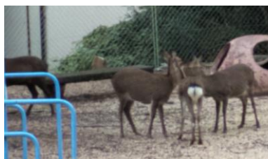
ホテルの近くにも鹿がいました