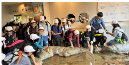
タッチプールでヒトデにタッチ