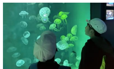
クラゲが泳いでいます