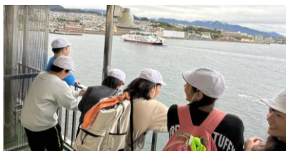
宮島までは10分間のクルーズ