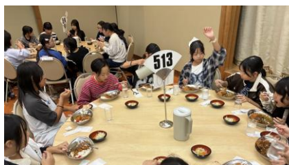
お昼ご飯はカツカレーでした