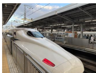
帰りの新幹線は「のぞみ」でした