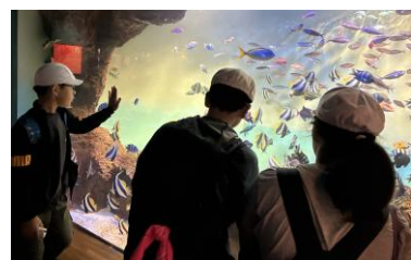
宮島水族館に行きました