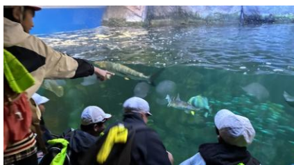
サメやエイの姿も見ることができました