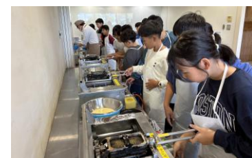
もみじ饅頭を手作り中