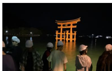
夜の散歩。大鳥居のライトアップ