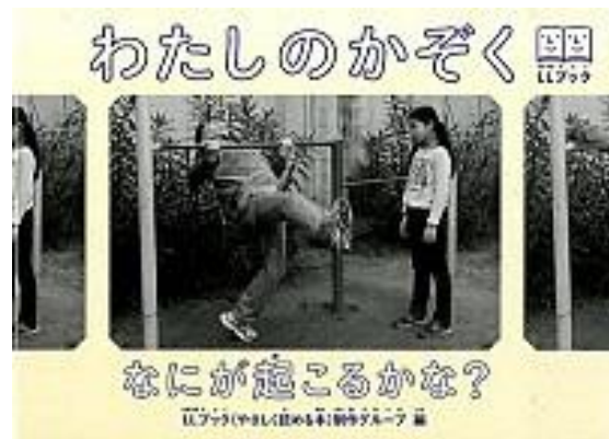
『わたしのかぞく』 じゅそんぼう 樹村房

むずか ひょうげん にほんご にがて ひと りょう 難しい表現や日本語の苦手な人に利用しやすいよう、やさしい ことば しゃしん え つか よ 言葉づかいで、写真や絵などを使って、わかりやすく読めるように くふう ほん 工夫した本です。