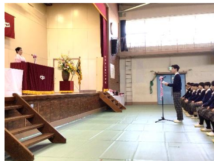
新旧生徒会長による送ることば(左)と卒業のことば(右)