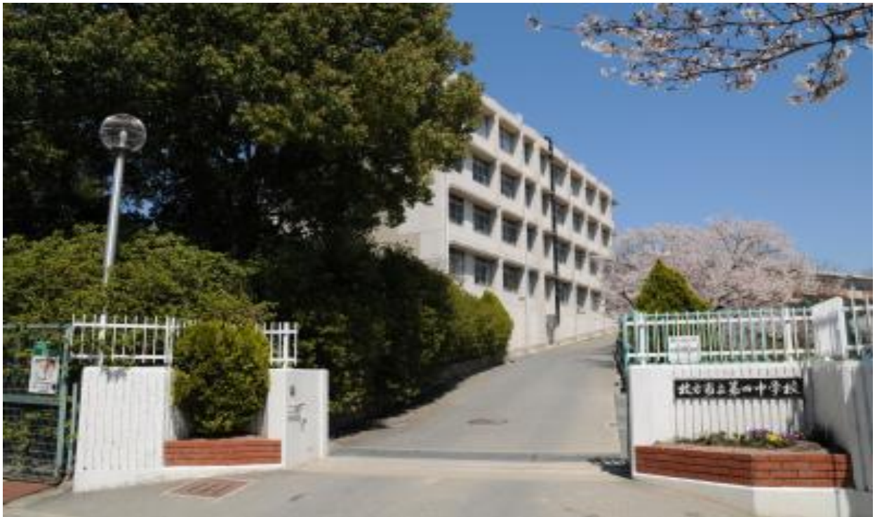
枚方市立第四中学校