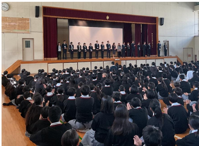
【始業式の様子(4月8日)】

この4月1日、本校に新しい教職員22名が着任しました。心機一転、教職員一丸となって、生徒の「居場所づくり」とともに生徒の「自己実現」が図れる学校づくりにつとめてまいります。本年度も本校の教育活動の推進にご理解とご協力をお願いいたします。