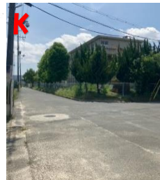
K 招提小横 不審者に注意