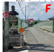
F 日置神社より北 道が狭く通行注意