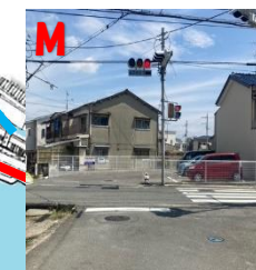
M 交差点 横断注意