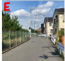
E 日置神社角、側道 道狭く車に注意!