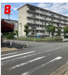
B 交差点 車に注意