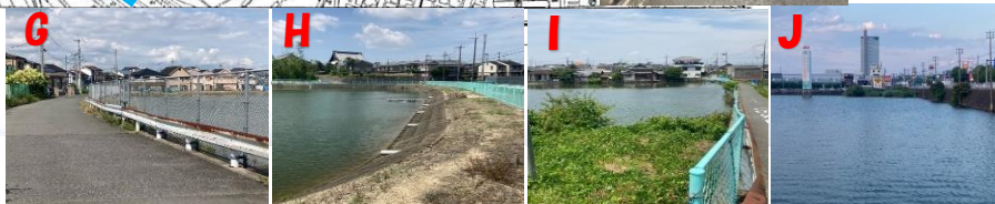
今池、丸池、御堂池、新大池等は危険なので絶対立ち入らない