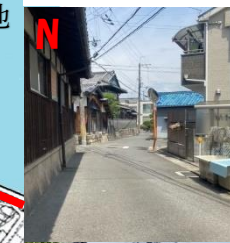
N 道幅狭く、人通り少ない