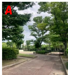
A 周りに配慮し 遊びましょう