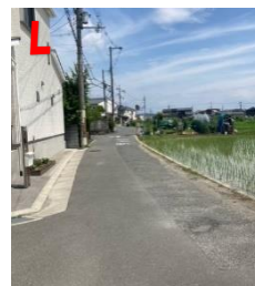
L 畑道 狭くて車に注意