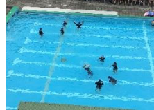
潜っている生徒も