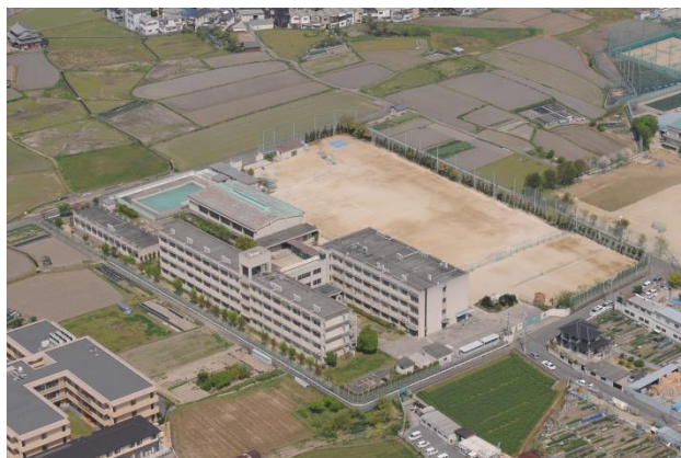
枚方市立山田中学校