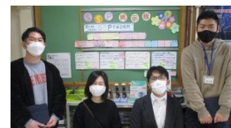
業務改善推進リーダーと会議改善チームメンバー。業務改善掲示板の前で。

会議日までに、共有シートに全クラス担任が記入。当日は内部系PCで、そのシートを見ながら会議を進行。補足のある担任のみ、口頭で説明し全体共有。