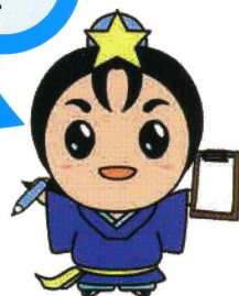
枚方市 ひこぼしくん

枚方市保健所 保健医療課 枚方市大垣内町2丁目2番2号 TEL: 072-807-7623 FAX: 072-845-0685