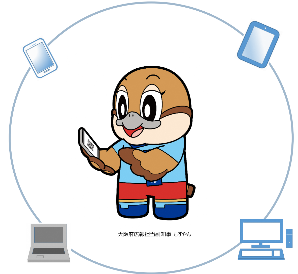
大阪府広報担当副知事 もずやん