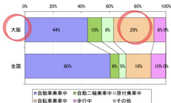
▲図 事故状態別死傷者数の割合

大阪では、自転車乗車中が全体の約3割を占めており、全国と比べても大きい傾向です。