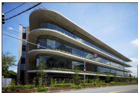
インターナショナル・コミュニケーション・センター (ICC)