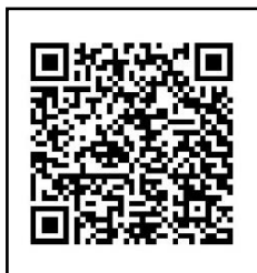
新 QR コード