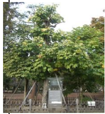
被爆したアオギリ

その後、原爆資料館の見学や平和公園内での碑めぐりを行動班ごとに行いました。子どもたちは、事前学習をしっかりと行っていたこともあり、一か所一か所を丁寧に聞きし、しおりに感想などを書き込んでいました。子どもたちは、肌で感じた戦争の悲惨さと平和の尊さを、これからの自分自身の学びに生かしていってくれることと思います。