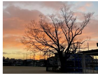
朝7時、朝焼けの中でのけやき