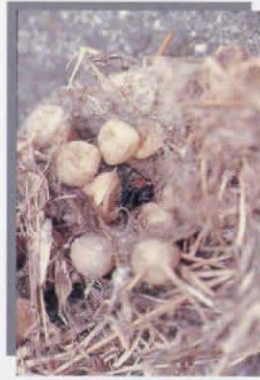
卵のう (卵が入っている袋)