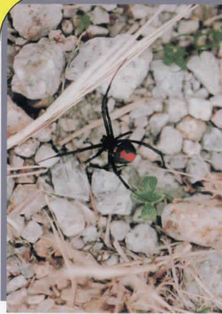
メス 体長約1cm 全体に黒く背に赤色の帯状の模様のあるのが特徴です。