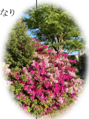
グラウンド東側 つつじの花