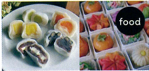
カフェ・ヒノデ （弁当・和菓子・コーヒー）

ワンちゃんと飼い主さんが一緒に食べられるクッキー、ワンちゃんのための雑貨、衣類、おやつなどを販売するお店が出店します。