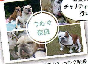
【保護犬譲渡会】つむぐ奈良