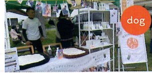
Nature.dog （フード&ケア用品&温灸ケア）