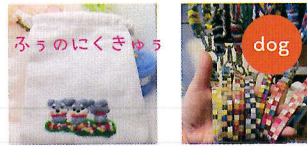
ふうのにくきゅう&りのん （羊毛フェルト・革雑貨）