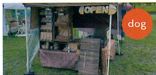
愛犬用ご褒美”やみつぎ覚悟。” （ワンちゃんのご褒美）