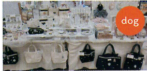
Handmade by Dearyou （手描き雑貨）