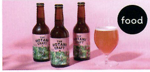
THE HOTANI CRAFT （クラフトビール）