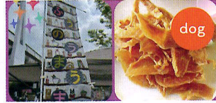
ふうのうまうま （ジャーキーとハンドメイド雑貨）