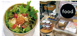
Ramen&Yakiniku ラ・コギ （まぜそば・奥ひらこってりラーメン）