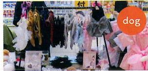
とりぶる はーと （ワンちゃんの洋服）