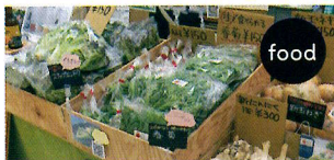
ひらかた独歩ふぁーむ （穂谷の野菜）