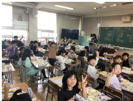
給食おいしいね (4年)

新しい学年が始まって1か月が過ぎようとしています。新しいクラスで、新しい担任の先生や友達と過ごす生活、ずいぶん緊張しながら過ごしたのではないかと思います。表面的には元気であっても、実際のところはかなり疲れている子どももいるのではないかと心配しています。ちょうど5月3日からはゴールデンウィーク後半の4連休があります。この連休にふだんとは違うところに出かけてリフレッシュするもよし、お家でゆっくりするもよし、心も体もしっかり休めてまた5月からの学校生活の備えてほしいと思います。