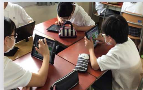
タブレット端末導入スケジュール(予定)

タブレット端末や大型モニタ、プロジェクタ等を活用し、教室内外を問わず、子ども同士による意見交換、発表などお互いを高めあう学びを通じて、思考力、判断力、表現力などを育成することが可能となります。