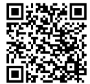
川越小学校ブログ

なお、学校での子どもたちの活動の様子やお知らせなどを、川越小学校のブログに掲載しております。右のQRコードを読み取って、ぜひご覧ください。