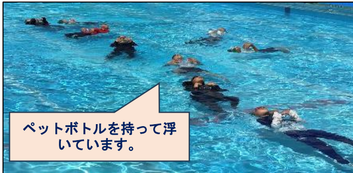
ペットボトルを持って浮いています。