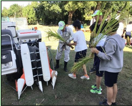
5年生の稲刈りの様子

今年の夏は昨年度より暑かったためか、稲は昨年度より大きく育ちましたが、サツマイモは、昨年度より小さなものが多かったです。収穫した米やサツマイモをどう活用するかについては、現在検討中です。