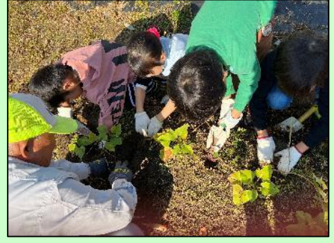
1年生の芋ほりの様子