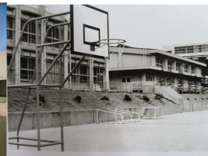
運動場から観る校舎と体育館