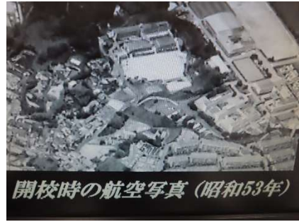
開校時の航空写真 (昭和53年)