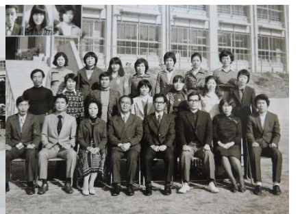
開校当初の教職員