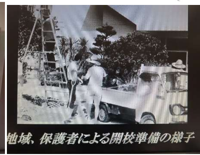
地域、保護者による開校準備の様子