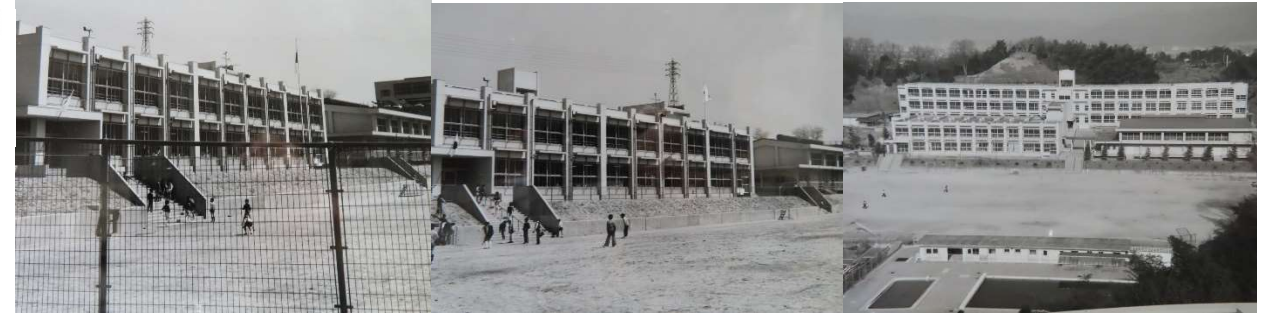
開校当時の学校の校舎と運動場