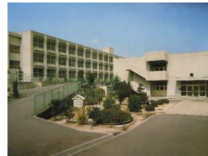
開校間もない校舎