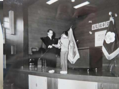
校歌や校旗の発表会