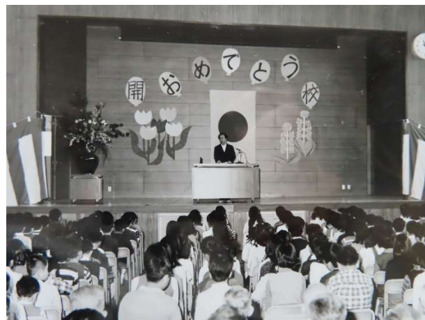
45年前の開校式の様子