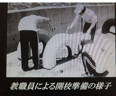
教職員による開校準備の様子