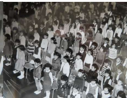
開校式の子ども達