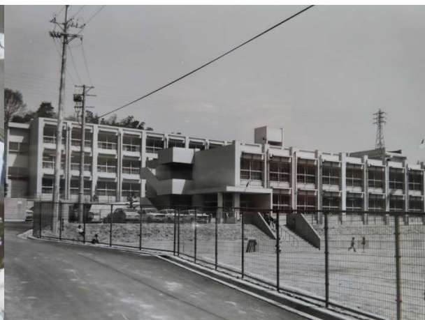
開校当時の学校の様子