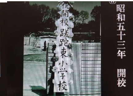
昭和五十三年 開校