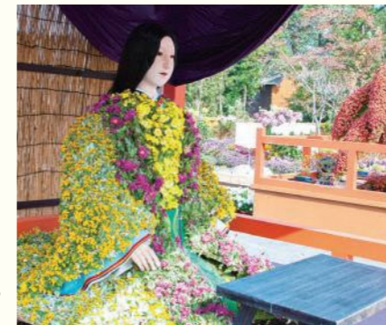
※画像は過去のものです。